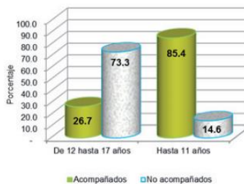
Eventos de retorno asistido de menores, según grupo de edad y condición de viaje, enero-abril de 2015