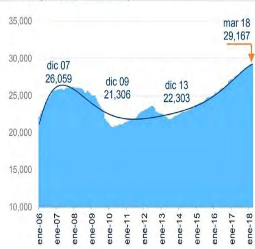
Gráfica 2. Flujos acumulados en 12 meses de remesas a México (Millones de dólares)