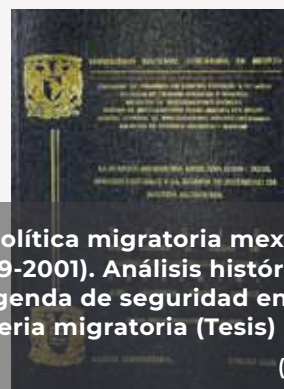
La política migratoria mexicana (1909-2001). Análisis histórico y la agenda de seguridad en materia migratoria (Tesis)

Pontificio Consejo para la Pastoral de los emigrantes e itinerantes Ediciones CEM (Conferencia para el Episcopado Mexicano)