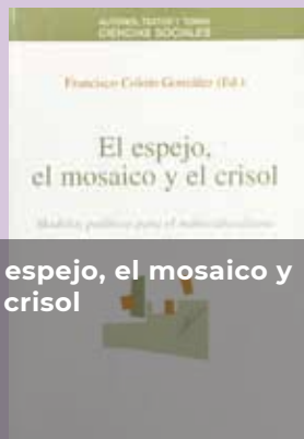
El espejo, el mosaico y el crisol