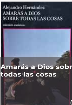
Amarás a Dios sobre todas las cosas