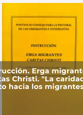
Instrucción. Erga migrantes, caritas Christi. "La caridad de Cristo hacia los migrantes"